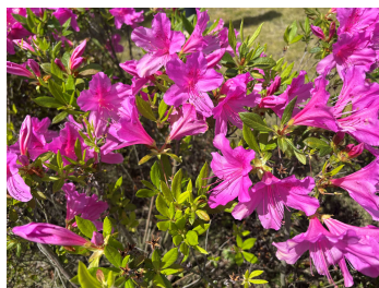
施設に咲くツツジ